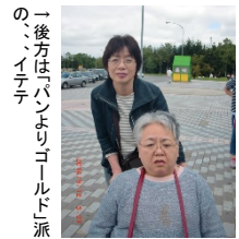
毎朝喫茶に一番乗りされるお客様。通称「福の神」様。

日ごろの喫茶ご愛用ありがとうございます。今回は、食パンの好きな方をご紹介したいと思います。