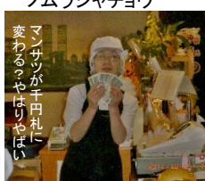
マンサツが千田札に変わる？やはりやはい