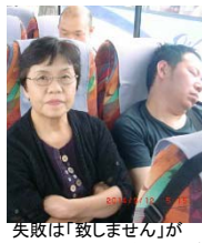
失敗は「致しませんが」がモットーのお客様。右はご飯党