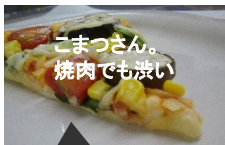
こまつさん。焼肉でも決い なす、トマト、コーンにチーズがたっぷり載る。これぞピッツァイタリアーナカラダの中から美しくなる絶妙な具材バランスをお試しあれ

続々開発中！おいしく痩せたい方にぴったりのベジタブルブレッドがこの秋からデビューです！