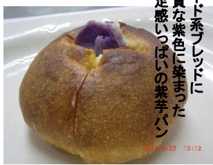
ハード系ブレッドに高貴な紫色に染まった満足感いっぱい紫芋パン

続々開発中！おいしく痩せたい方にぴったりのベジタブルブレッドがこの秋からデビューです！