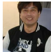
●●パン大好き。ドリフト系(ドリフ系かも)