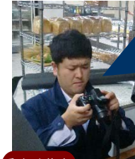
キャー！旅行は羽目を外した殿方の本性をハラすチャンスよー！